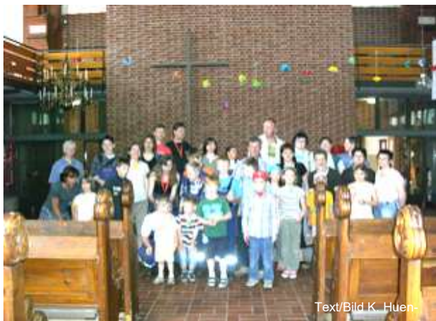
Text/Bild K. Huen-

Wetter sogar ein Tanz und Schwungtuchspiele draußen. Das Angebot wird so gut angenommen, dass wir es nach den Sommerferien weiterführen möchten, etwa einmal im Monat, samstags von 9-12 Uhr. Laden Sie Ihre Nachbarkinder doch mit ein - auch weitere freiwillige Helfer sind immer willkommen.