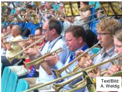
Text/Bild: A. Weldig

Ohrenblickmal – war Thema und auch Aufgabe des Evangelischen Landesposaumentages 2008 in Leipzig, zu dem sich auch der Posaunenchor Hagenow aufmachte. Gemeinsam sollten wir ein unvergessliches Wochenende mit viel Musik, Spaß und neuen Erfahrungen verbringen und starteten somit am Freitag in Richtung Leipzig. Nach 4 Stunden Fahrt kamen wir am Ziel der Reise an, lernten unsere Gastfamilien kennen und verbrachten den ersten Abend zusammen bei einem kleinen Konzert und einem Schlummertrunk in der Stadt.