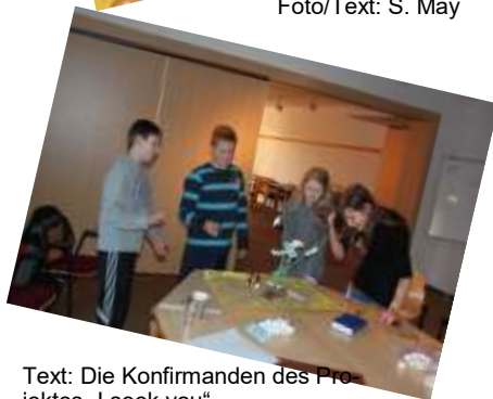
Text: Die Konfirmanden des Projektes „I seek you“