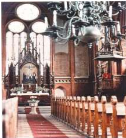
Kirchenansicht vor dem Umbau 1977

Zum Fest der Goldenen Konfirmation am 24. und 25. September 2011, sind die in Hagenow Konfirmierten der Jahre 1960 / 1961 (mit Ehepartner) sehr herzlich eingeladen. Ebenso gilt diese Einladung denen, die anderswo konfirmiert wurden, jetzt aber in unserer Kirchgemeinde wohnen. Da wir noch nicht von jedem Konfirmanden Ihres Jahrganges die derzeitige Adresse haben, sind wir für jede Mitteilung von Namen und Anschriften dankbar.