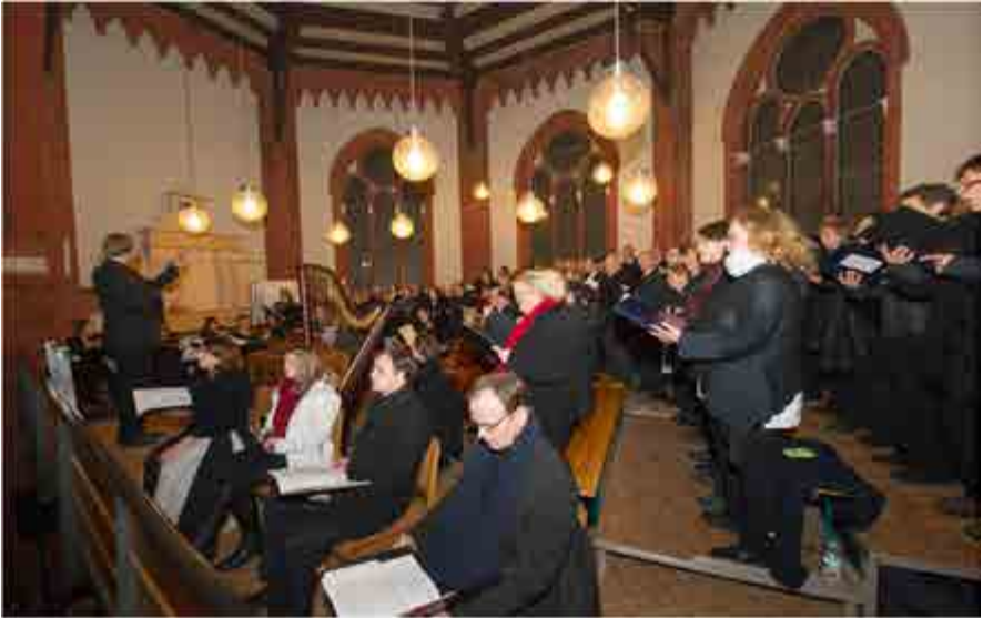
Dezember 2015